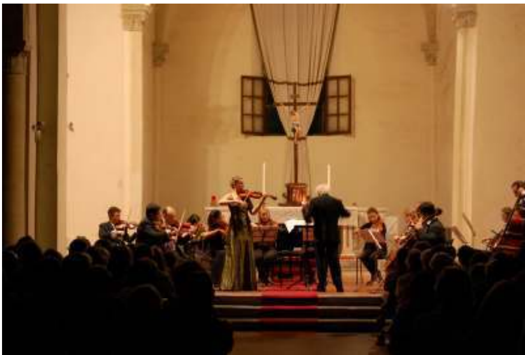
Chiesa di San Francesco 2009